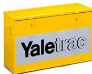
Optional: Yaletrac Seilzugbox aus Stahlblech ca. 74x26x45 cm