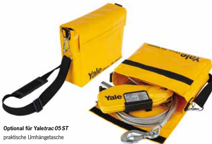
Optional für Yaletrac 05 ST praktische Umhängetasche

MODELLERWEITERUNG JETZT AUCH MIT 500 daN ZUGKRAFT! FÜR DEN MOBILEN EINSATZ