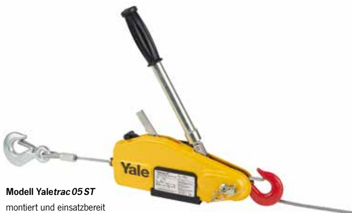
Modell Yaletrac 05 ST montiert und einsatzbereit